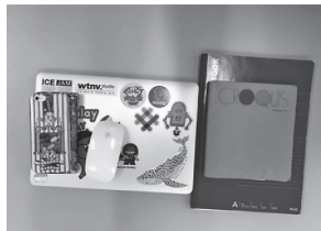
様々な YAHOO LODGE イベント MacBook と一緒にクロッキー帳